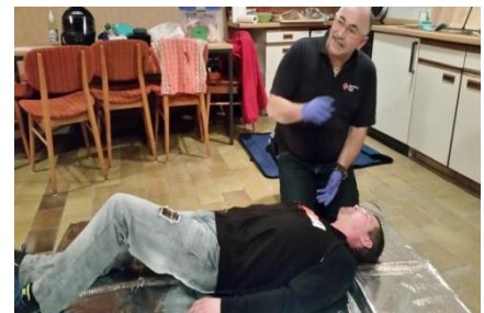
Übung Erste Hilfe