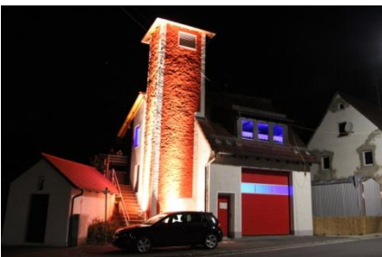
125 jähriges Jubiläum