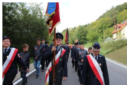
125 jähriges Jubiläum