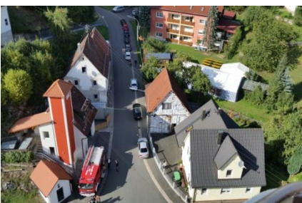
125 jähriges Jubiläum