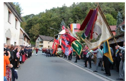
125 jähriges Jubiläum